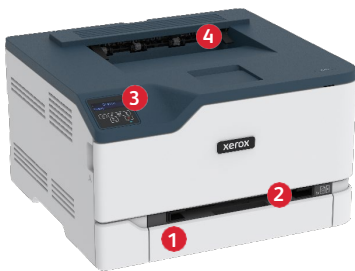
Xerox® C230 -väritulostin