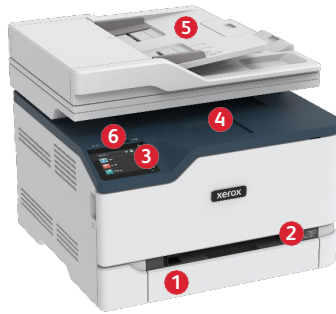
Xerox® C235 -värimonitoimitulostin